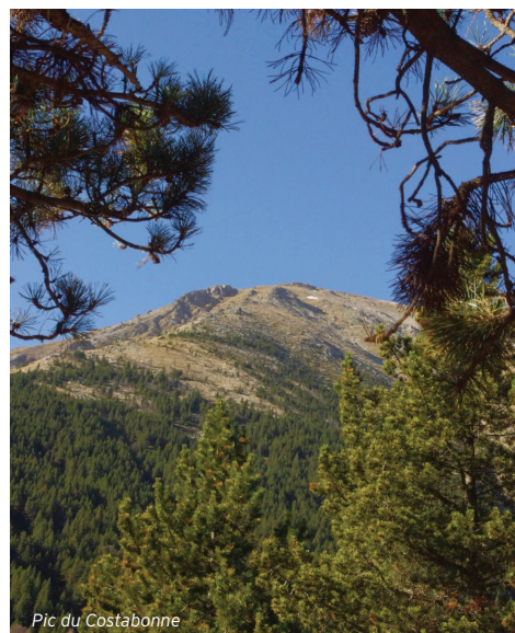
Pic du Costabonne