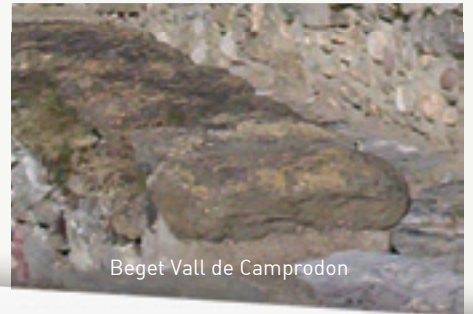
Beget Vall de Camprodon