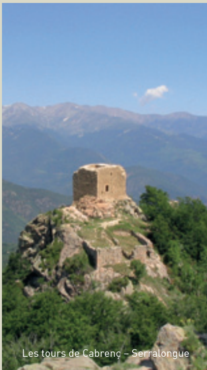
Les tours de Cabrenç – Serralongue