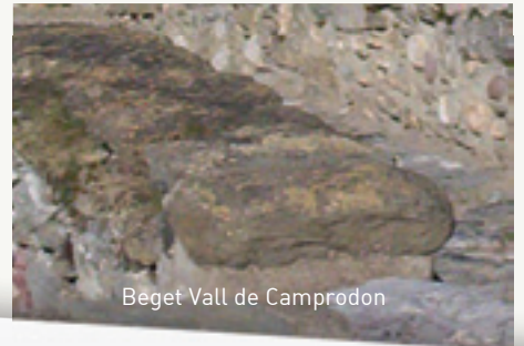
Beget Vall de Camprodon