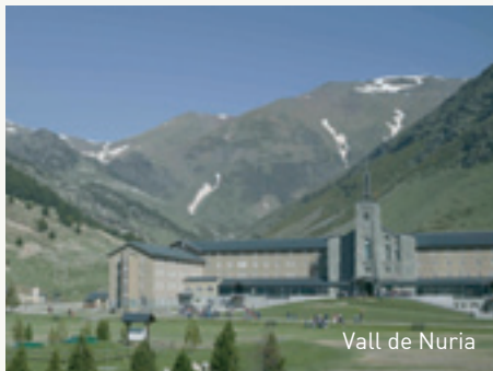
Vall de Nuria