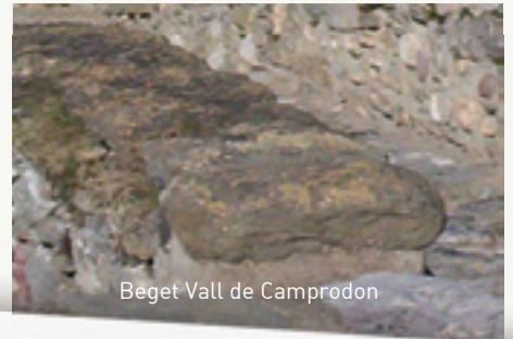
Beget Vall de Camprodon